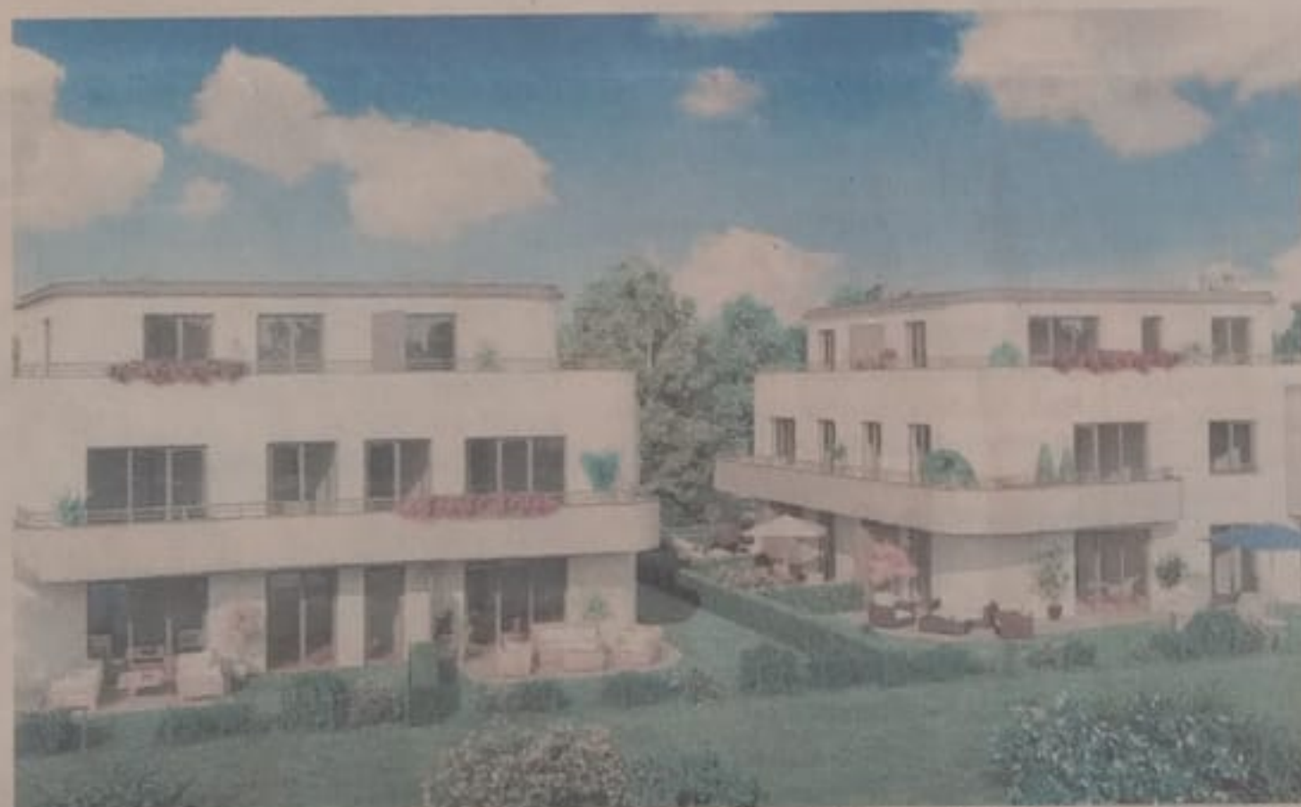
In München-Obermenzing arbeitet das WieBoTec-Team gemeinsam mit seinen Subunternehmern in der Baureihe gerade an einem Objekt mit 14 Wohneinheiten und Tiefgarage.